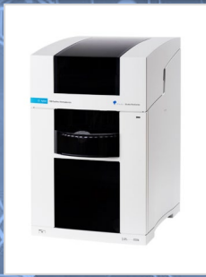
Agilent Technologies キャピラリー電気泳動システム Agilent 7100

キャピラリー電気泳動(CE)は、液体クロマトグラフィー(LC)やイオンクロマトグラフィー(IC)と同様に溶液中の成分を分離・定性・定量する分析手法です。 CEを使えばICで分析する無機イオン、LCで分析する有機酸類、原子吸光(AAS)で分析する金属イオンなどを1台で測定できます。