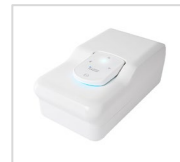
ゼータ電位・粒子径・ 分子量測定システム ELSZneo